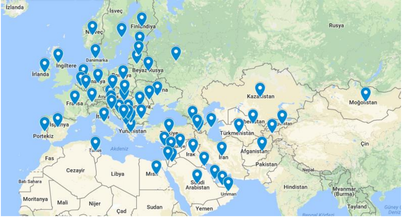
2018 yılı içerisinde Türk araçlarının karayolu ile taşımacılık yaptığı ülkelerin harita üzerinde gösterimi